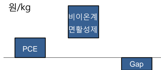
비이온계면활성제와 PCE 가격 차이